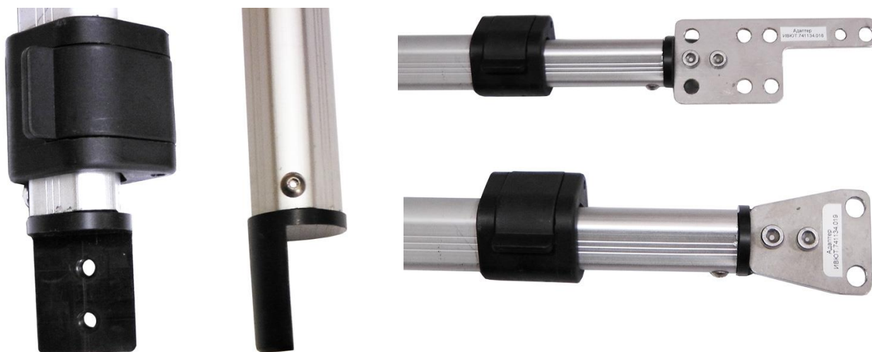
Вставка для крепления оборудования