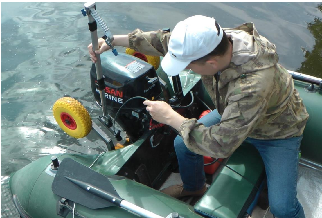
Установка на транец лодки