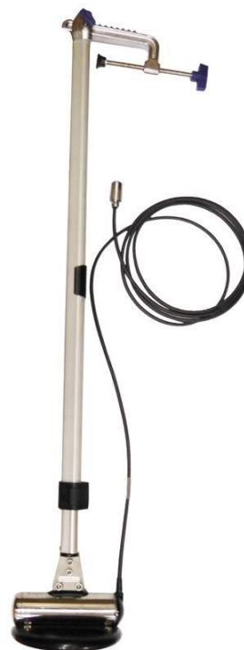
Пример крепления гидролокатора H5p3D (через адаптер ИВЮТ.741134.019)