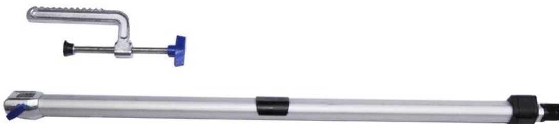
Набор в разобранном виде

Набор может использоваться практически на любых надувных ПВХ лодках, RIB.