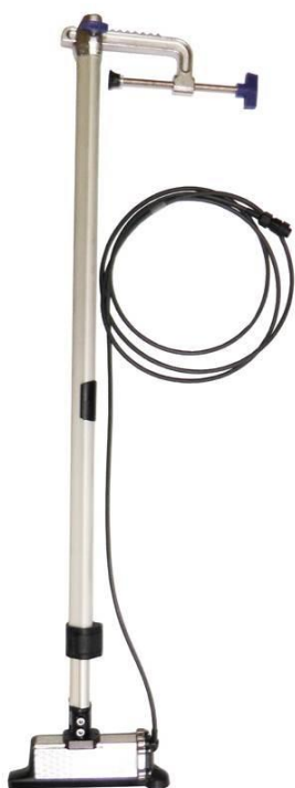
Пример крепления гидролокатора H5se7 (напрямую к вставке)